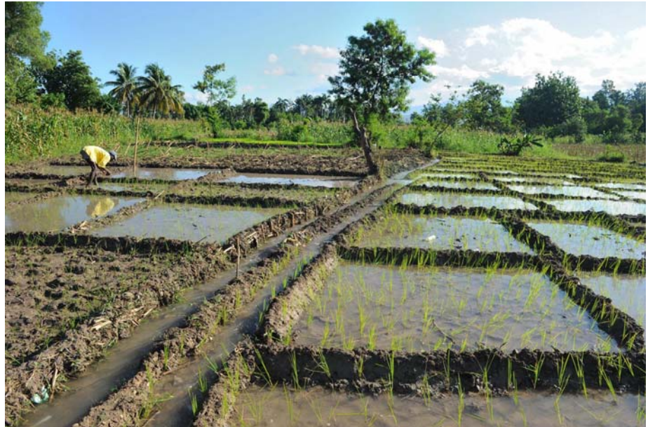
Aprè tranblemanntè 12 Janvyè 2010 la, yon gwo kantite deplase al rete nan La Vale Atibonit . Kèk moun rive jwenn travay sou kèk plantasyon.

Defi ak okazyon agrikòl pou rekonstriksyon Ayiti