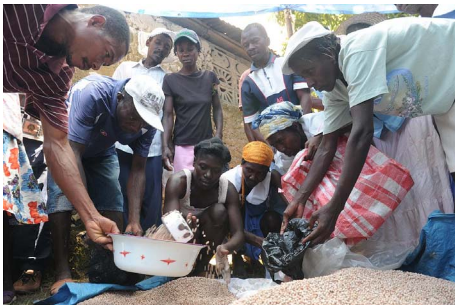
Distribution de semences à Desvarieux. Crédit : Oxfam America/Ami Vitale.

Source : Comité permanent inter-agences, Genève