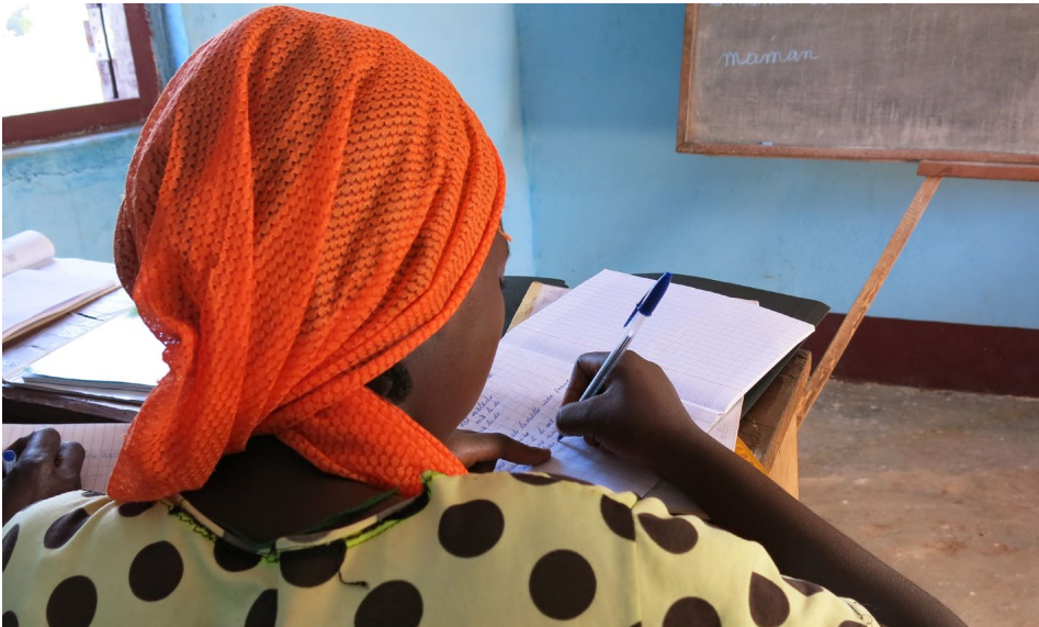
Une jeune femme apprend à lire et à écrire dans un cours du Women's Home à Bria, au cœur de la République centrafricaine, qui offre des services éducatifs aux personnes ayant été confrontées à des violences.