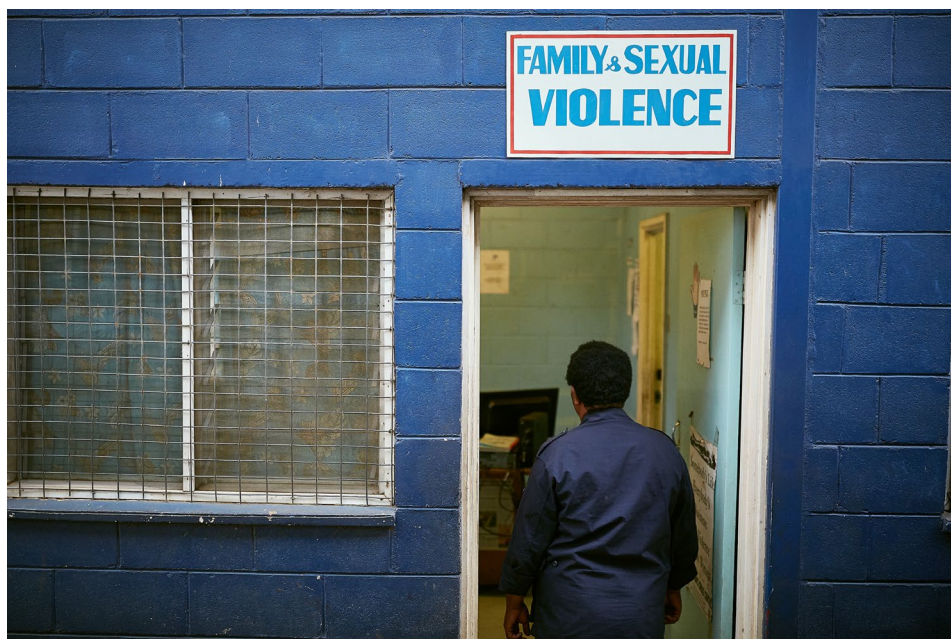
En Papouasie-Nouvelle-Guinée, Marie* enquête sur des crimes basés sur le genre.

faisant appliquer les mesures d'endiguement du coronavirus, avec l'installation de postes de contrôle et la mise en place des quarantaines et des couvre-feux 20 . De même, dans les secteurs où les femmes cisgenres et transgenres sont sur-représentées, comme le travail domestique et la santé, elles ont observé une forte augmentation des violences 21 , tout comme les travailleuses migrantes, isolées avec leurs employeurs et dans l'incapacité de contacter leurs familles et leurs cercles de soutien 22 .