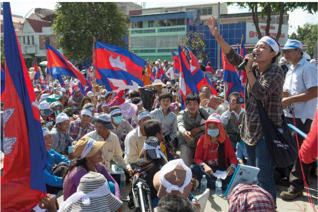
Des ouvriers et ouvrières d'une usine textile manifestent dans les rues de Phnom Penh. Ils et elles réclament de meilleurs salaires et conditions de travail et le respect de leurs droits en tant que salariées.

Voir les références suivantes : L'Académie de macroéconomie féministe africaine de FEMNET 18 ; le Climate Negotiator Delegates Fund de l'Organisation des femmes pour l'environnement et le développement 19 ; la documentation (en anglais) de la Commission Huairou sur les innovations des femmes au niveau local en matière de propriété foncière et du contrôle de propriété 20 , de résilience aux catastrophes 21 et de gouvernance locale pour l'éradication de la pauvreté 22 ; un guide rapide sur la fiscalité en faveur de l'égalité de genre (en anglais) d'Oxfam et d'un groupe de femmes sur le budget 23 ; des guides (en anglais) du Center for Feminist Foreign Policy 24 ainsi que des formations, des notes d'information et des soumissions du Asia Pacific Forum on Women, Law and Development sur les traités et accords commerciaux régionaux et internationaux actuellement en cours de négociation 25 .