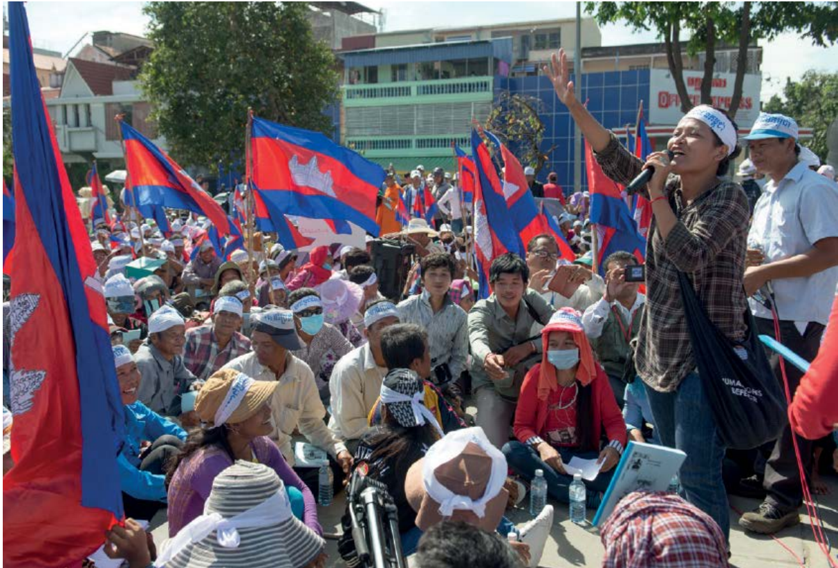
مسيرة لعمال مصنع الملابس بسبيرون في شوارع بنوم بن في كمبوديا. وهم يتظاهرون من أجل أجور وظروف عمل أفضل وحقوقهم كموظفين.