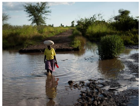
Gwybodaeth am y llun: Croesi tir dan ddŵr yn ne Malawi yn dilyn Seiclun Idai. Achosodd llifogydd eang i gartrefi llawer o bobl gwmpo, a dinistriwyd caeau o gnydau.