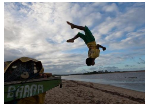
Gwybodaeth am y llun: Bechgyn yn chwarae ar y traeth yn Barra de Sirinhaém, Pernambuco, Brasil

Yn y Môr Tawel, mae ynsoedd cyfan yn gorfod gadael, wrth i lefelau'r môr godi a halogi'r pridd â halen. Mae dwy o'r ynsoedd sy'n ffurfio Kiribati (lun o wledydd ynys Pacific) eisoes wedi'u colli i'r tonnau. Mae llawer o ddinasoedd mawr y byd ger yr arfordir; mae tua 10% o boblogaeth y byd yn byw mewn ardaloedd arfordirol sydd lai na 10 metr uwchben lefel y môr. 1