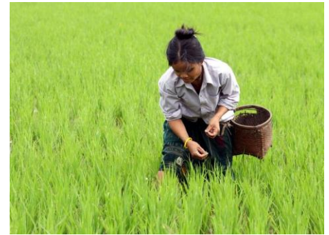
Gwybodaeth am y llun: Ffermwr reis yn Fiet-nam.