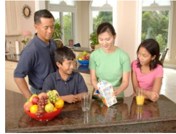
Bill Branson, Wikimedia Commons