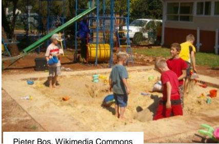
Pieter Bos, Wikimedia Commons