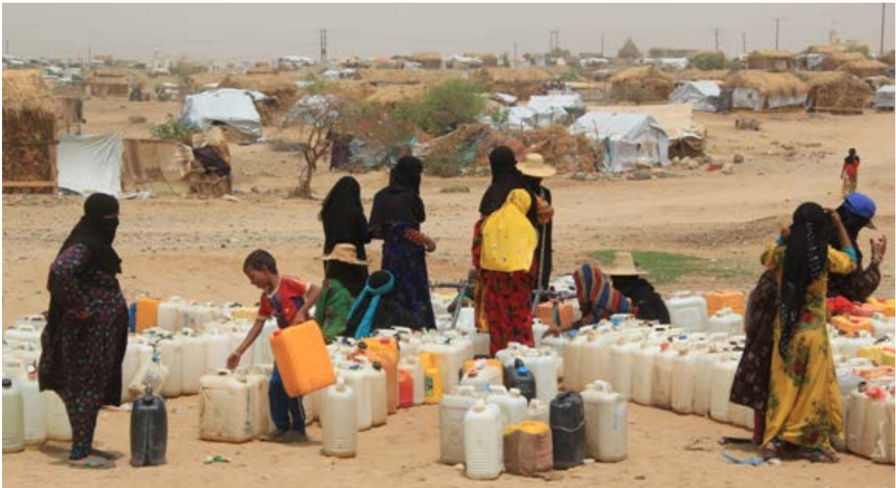
Point d'eau dans le camp d'Al-Manjorah, à Bani Hassan, dans le district d'Abs, gouvernorat d'Hajjah.