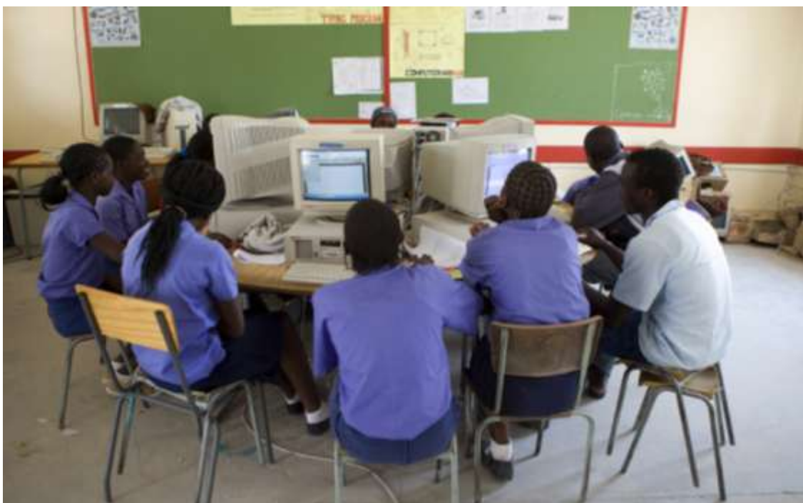
Una sala de ordenadores de la escuela Oneputa Combined School, en el norte de Namibia. El Gobierno del país está comprometido con la reducción de la desigualdad, y la educación secundaria es gratuita.