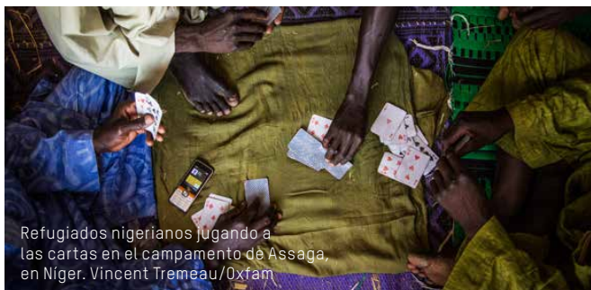
Refugiados nigerianos jugando a las cartas en el campamento de Assaga, en Níger.