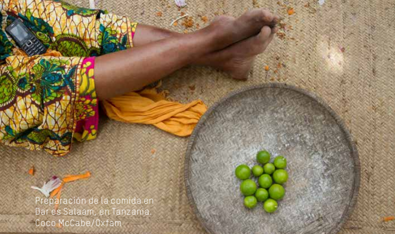
Preparación de la comida en Dar es Salaam, en Tanzania.