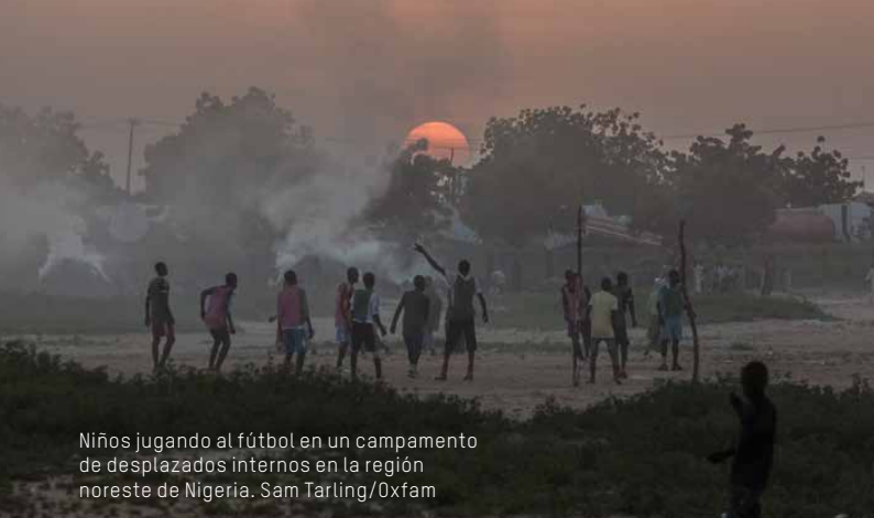
Niños jugando al fútbol en un campamento de desplazados internos en la región noreste de Nigeria.