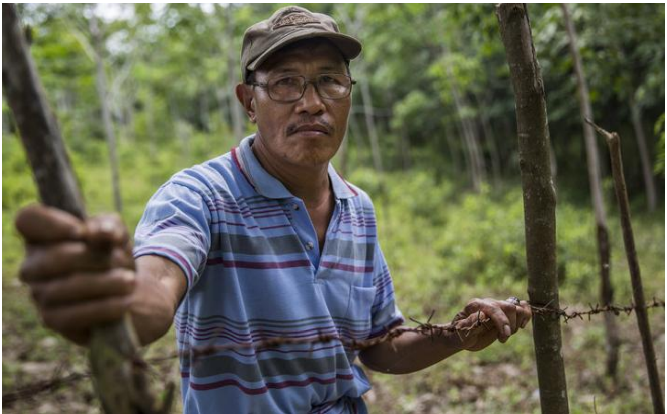
La aldea de Lunjuk (Indonesia), 2016. Un campesino tuvo que colocar una alambrada de púas para proteger sus tierras después de que fueran despejada para dar paso a una plantación para proveer de aceite de palma a la multinacional Wilmar.