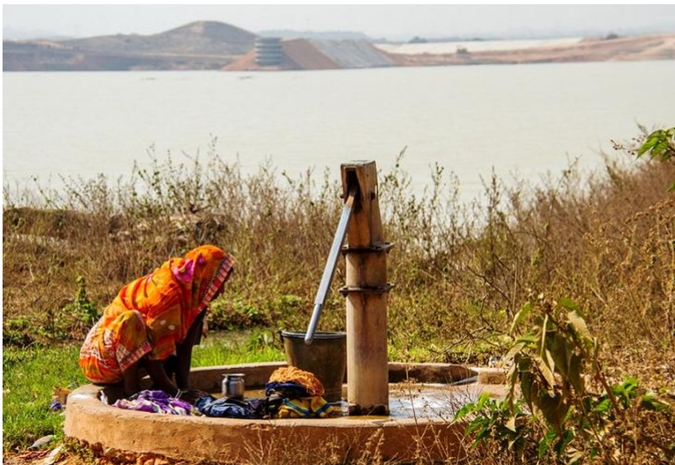
Una mujer lava la ropa en una fuente de agua potable cercana a un pozo de cenizas tóxicas del proyecto Sasan, en Singrauli; la explotación minera puede verse al fondo.