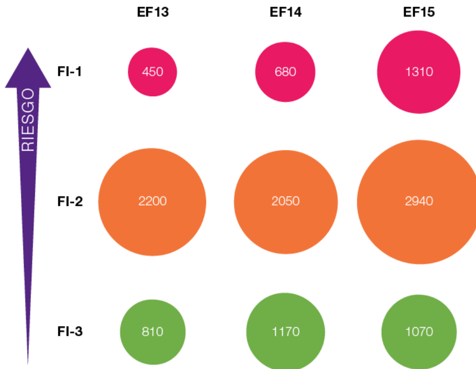
Gráfico 2: Compromisos a largo plazo de los intermediarios financieros de la CFI por categoría medioambiental y social (en millones de dólares)

Fuente: informes anuales de la CFI para los ejercicios fiscales 2013–2015. 10