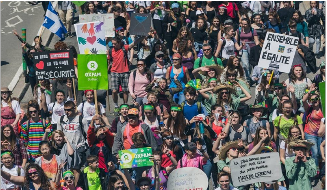
Marche Monde, Montréal, 6 mai 2016.