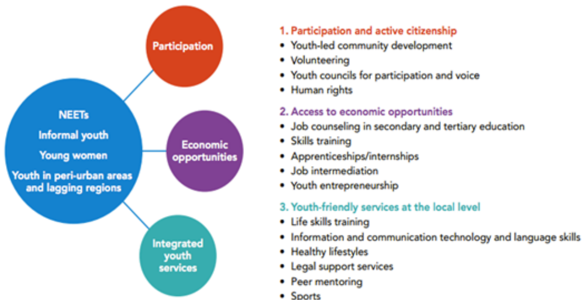
Figure 2 : Politique multidimensionnelle pour l'inclusion des jeunes