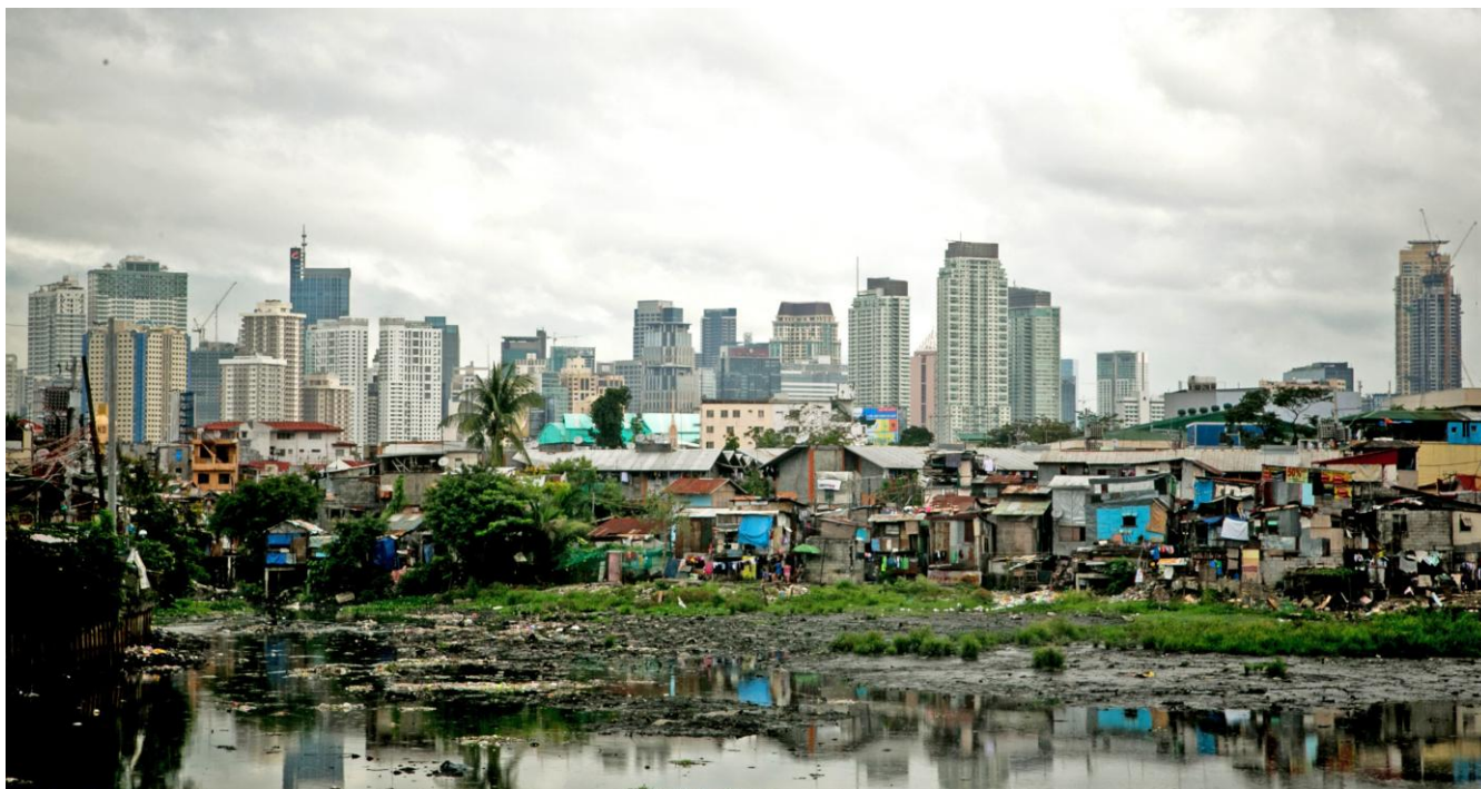
Barrio de chabolas en Tondo, Manila, Filipinas (2014).