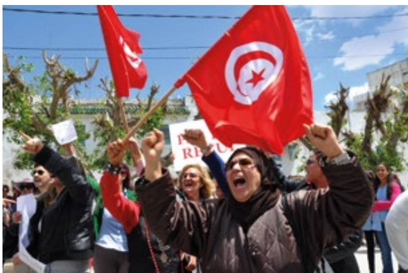
Mulheres protestam na Assembleia Constituinte da Tunísia, exigindo paridade na lei eleitoral (2014).

Os extremos da desigualdade atuais são ruins para todos. Para os mais pobres da sociedade, quer vivam na África Subsaariana ou no país mais rico do mundo, a oportunidade de sair da pobreza e viver uma vida digna é fundamentalmente bloqueada pela desigualdade extrema.