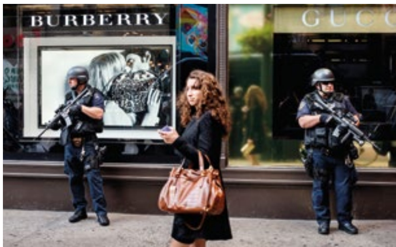
Uma mulher passa por dois policiais fortemente armados, que guardam uma loja de departamentos em Manhattan (2008).

Pelo terceiro ano consecutivo, o relatório Riscos Globais do Fórum Econômico Mundial apontou a “grande disparidade de renda” como um dos principais riscos globais para a próxima década. 42 Um número crescente de evidências também demonstrou que a desigualdade econômica está associada a uma série de problemas de saúde e sociais, incluindo doenças mentais e crimes violentos. 43 Isso se aplica igualmente a países ricos e pobres e tem consequências negativas tanto para as pessoas mais ricas quanto para as mais pobres. 44 A desigualdade prejudica a todos.