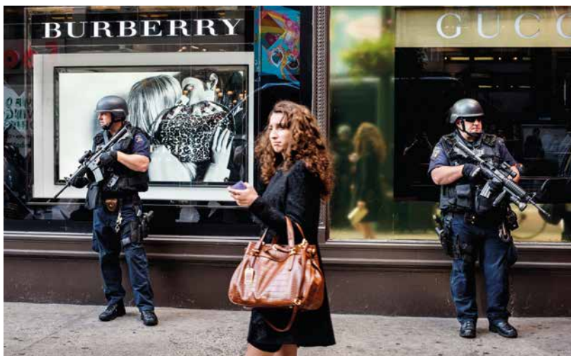
Une femme passe devant deux policiers lourdement armés gardant l'entrée d'un grand magasin à Manhattan (2008).

Des données probantes démontrent que, lors de tests, les personnes interrogées ont instinctivement l'impression que le bât blesse en cas de niveaux élevés d'inégalité.