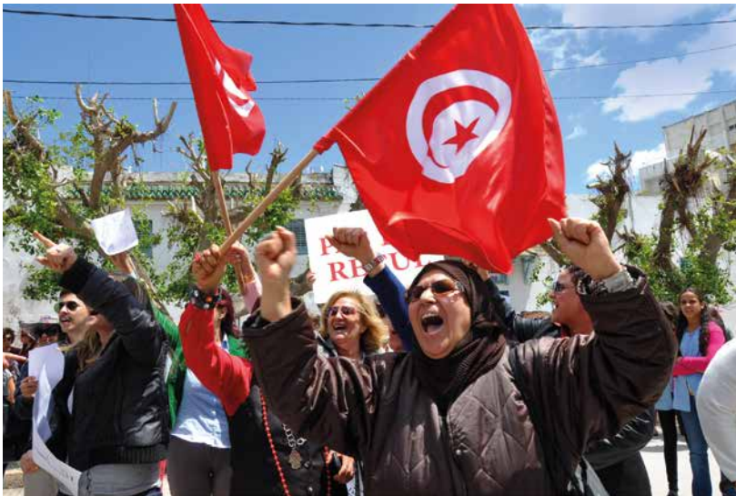
Des femmes manifestent devant l'Assemblée constituante tunisienne, et réclament la parité dans la loi électorale, Tunisie (2014).

À l'heure actuelle, les inégalités extrêmes nuisent à tous. Elles ne permettent pas aux personnes les plus pauvres dans la société, qu'elles vivent en Afrique sub-saharienne ou dans le pays le plus riche du monde, de sortir de la pauvreté extrême et de vivre dans la dignité.