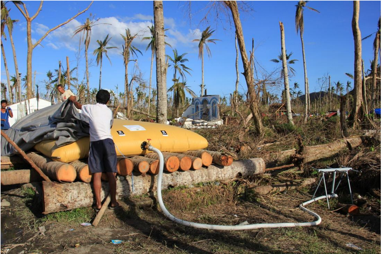
Réservoir d'eau contenant 10 000 litres d'eau potable installé à Maribi dans la province de Leyte (décembre 2013).