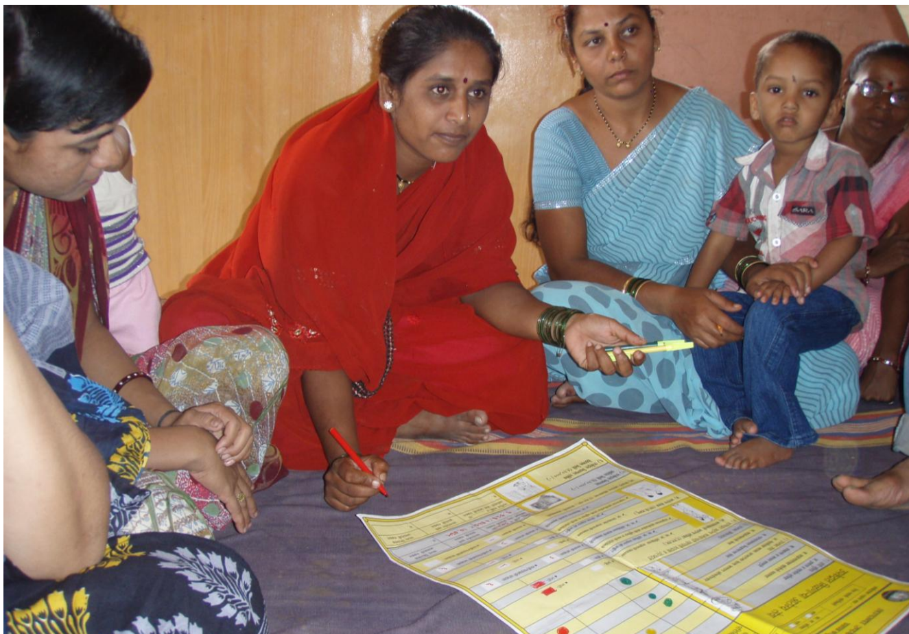
Mujeres cumplimentando una hoja de seguimiento y evaluación participativa en una aldea del distrito de Bhor, en el estado de Maharashtra de la India (2011).