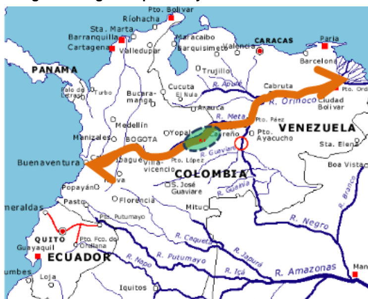
Figura 2. Eje de integración regional que incluye a la Altillanura colombiana