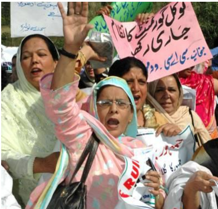
Protesta en Islamabad, coordinada por los WLG en contra de las propuestas para modificar las cuotas de mujeres en el Gobierno local (2010).