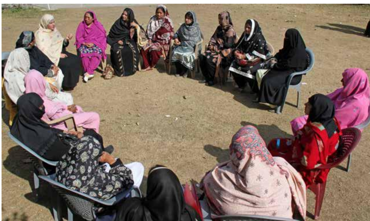
Reunión mensual del WLG en Hafizabad sobre incidencia política.