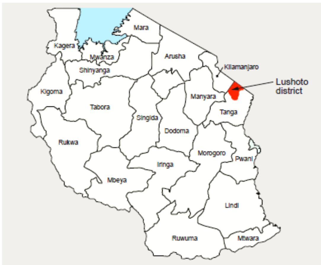
Distrito de Lushoto, región de Tanga, Tanzania