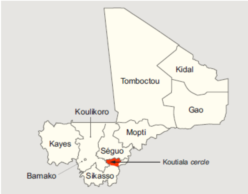
Círculo de Koutiala, región de Sikasso, Mali