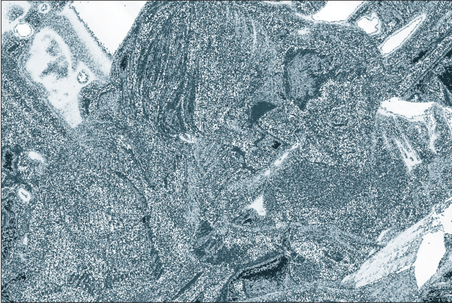
Pour un enseignant qualifié, l'enfant est au centre du processus d'éducation (Les Pays-Bas)

a été publiée sur le site Web de SBL et largement diffusée auprès du corps enseignant sous forme de CD-ROM et de documentaire vidéo. Ce dernier a fait l'objet de multiples projections suivies d'échanges d'idées à l'occasion de centaines de rencontres (ateliers, conférences, séminaires) réunissant des groupes d'enseignants. A la demande de SBL, 15 000 exemplaires du CD-ROM ont été distribués 251 . Selon une partenaire sociale de SBL, tous les enseignants n'ont pas reçu un CD-ROM, malgré sa distribution à travers le pays. «C'est dû à un problème de logistique», explique-t-elle. «Cela étant, il incombe à chacune et à chacun de connaître la loi».