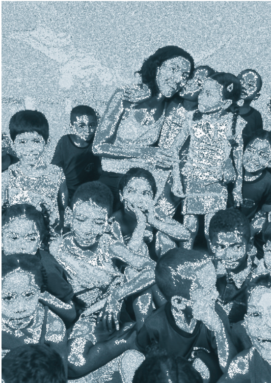
Les Enseignants qui aiment et respectent les enfants les rendent heureux et motivés (Brésil)

D'autres raisons avancées par les intervenants attestant de l'absence actuelle d'un CP national au Brésil incluent: