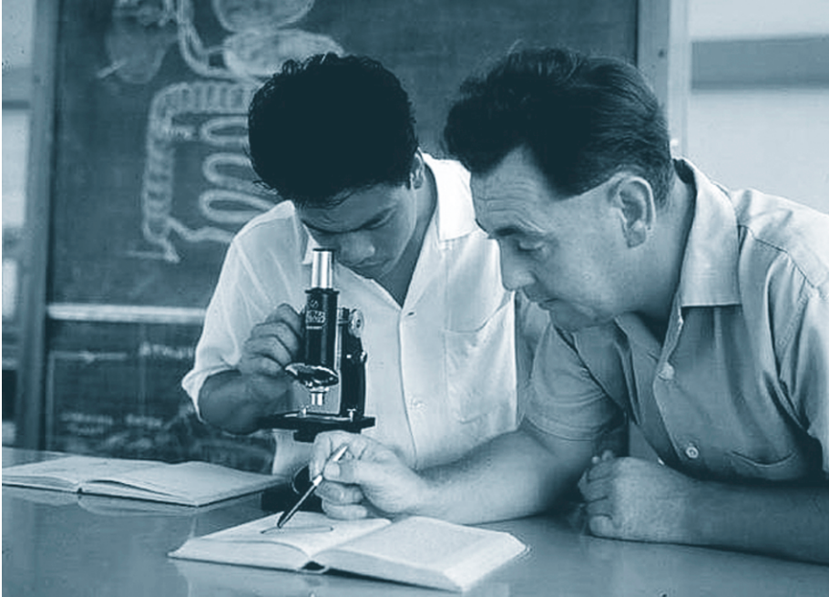
Un enseignant compétent est passionné par l'enseignement et est avide de nouvelles connaissances (Malaisie)

La majorité des enseignants affirment que les compétences décrites dans le LNPT n'incluent pas certaines qualités essentielles qu'un bon enseignant doit avoir. D'ailleurs, expliquent-ils, il peut s'avérer difficile, voir impossible, pour les enseignants de travailler suivant certaines compétences. Prenons par exemple la « méthodologie de l'enseignement interactif ». Un enseignant :