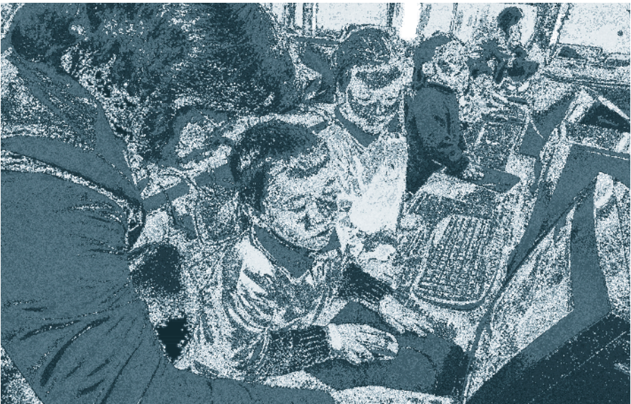
Les compétences TIC des enseignants sont cruciales pour préparer les enfants à l'avenir (Chili)

contradiction ouverte avec les concepts modernes et professionnels de l'époque. 216 L'incongruité de cette mesure et les protestations des acteurs concernés a fait reculer les autorités militaires, les poussant, en 1987, à reconvertir en universités pédagogiques deux des Académies supérieures qui avaient appartenu à l'Université du Chili. Quelques années plus tard, avec la promulgation de la Loi organique sur l'éducation (1990), la formation des enseignants retrouva son statut de carrière universitaire. A l'heure actuelle, les universités dispensent des programmes menant à une licence et à une qualification pour l'enseignant. Une poignée d'instituts de formation professionnelle sont autorisées à former des enseignants et à délivrer une qualification professionnelle, mais pas de diplôme. 217