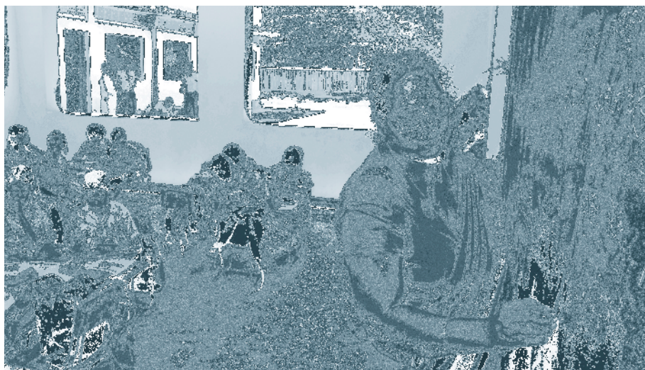
Les enseignants efficaces aiment leur métier et le travail avec les enfants (Inde)

d'une École normale du South District de Delhi sont les suivants :