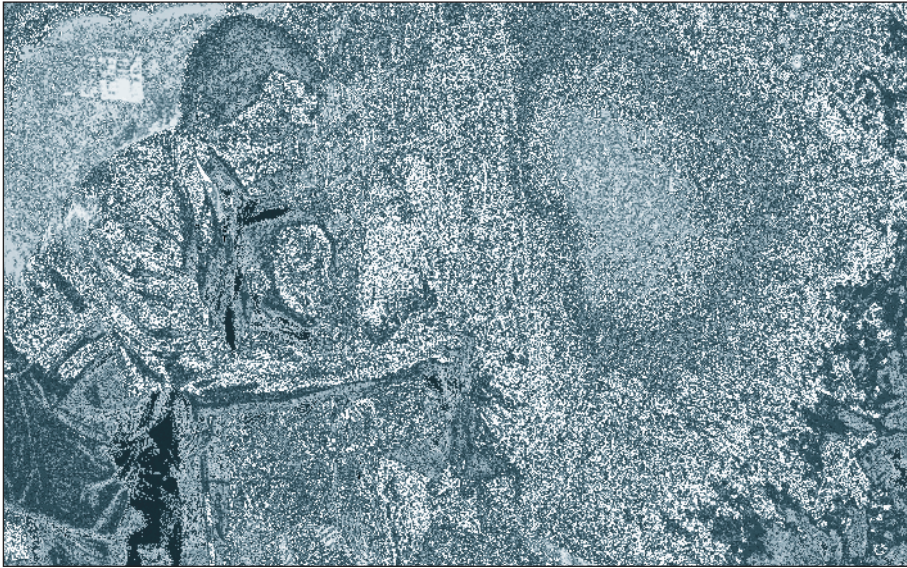
Une formation de qualité est indispensable pour acquérir les compétences (Mali)

L'étude de faisabilité commandée par le projet Éducateurs de qualité pour tous (juin-juillet 2008) et le rapport '«Profil d'un enseignant de qualité au Mali» (août 2010) indiquent que même si l'étude analytique des besoins effectuée en décembre 1999 était censée reposer sur une consultation et un consensus larges, les OSC, les parents et les élèves n'ont pas été impliqués. En outre, aucune politique de validation et de diffusion n'a été mise en place. En conséquence, le profil de compétence est resté méconnu de la plupart des acteurs du secteur et, de ce fait, n'a pas été utilisé.