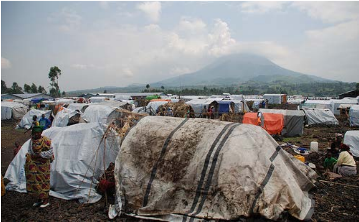
Site de PDI de Kanyaruchinya, au nord de Goma (Nord-Kivu, RDC), septembre 2012.