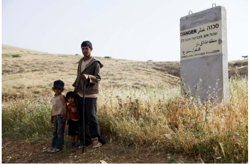
أسرة فلسطينية في وادي الأردن. لا يستطيعون ترك حيواناتهم ترعى في المرعى لأن أرضه تم إعلانها منطقة عسكرية إسرائيلية مغلقة.