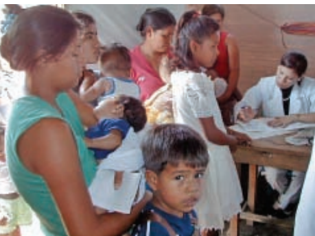
Überfüllte Ambulanz, Nikaragua.