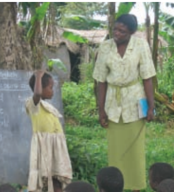
1,9 Millionen zusätzliche Lehrkräfte werden benötigt.

Vergleichen Sie dies mit den globalen Militärausgaben in Höhe von 1.000 Mrd. US$ pro Jahr oder den 40 Mrd. US$, die in der Welt alljährlich für Tiernahrung ausgegeben werden.