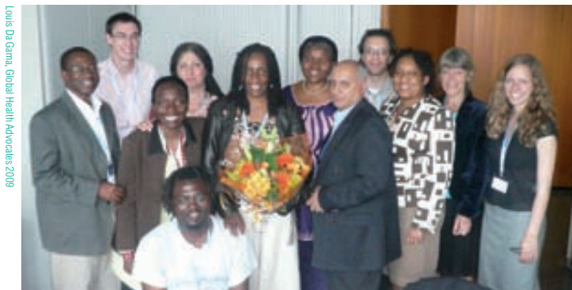
Miembros del grupo asesor de la delegación de la sociedad civil ante UNITAID en una oficina de la Organización Mundial de la Salud tras una sesión del consejo de UNITAID en mayo de 2009.