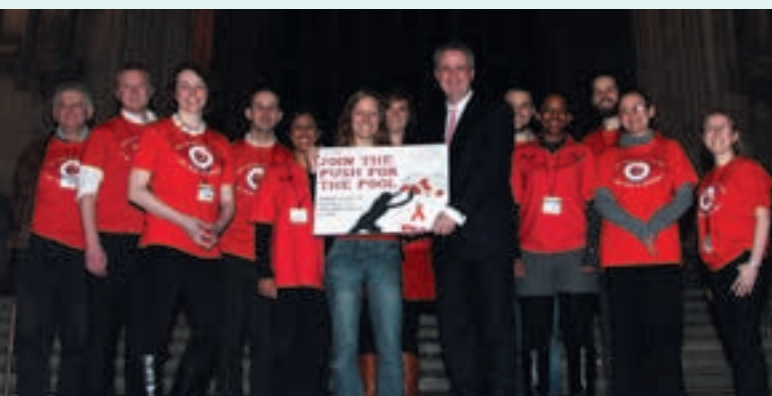
Lynda Land 2009

Para más información sobre la campaña de apoyo al consorcio de patentes en Reino Unido y para ver varias animaciones que explican el Consorcio de Patentes, ver: http://www.stopaidscampaign.org.uk/