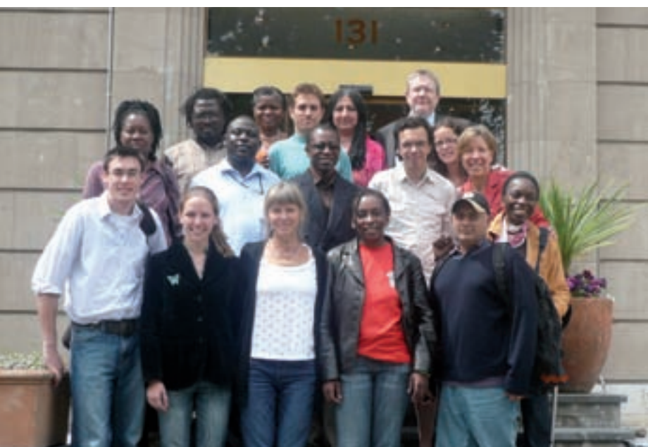
Miembros del grupo asesor de la Sociedad Civil después de una reunión de representantes de la Sociedad Civil previa a una sesión del Consejo de UNITAID en Ginebra, mayo de 2009.

Entre otras cosas el Grupo se encarga de asesorar a las delegaciones de la Sociedad Civil para formular mejores políticas y desarrollar campañas más efectivas. El Grupo colabora mediante documentos, teleconferencias y reuniones para discutir