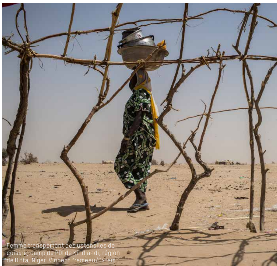
Femme transportant des ustensiles de cuisine; camp de PDI de Kindjandi, région de Diffa, Niger.

Witness guides on using video responsibly https://fr.witness.org/