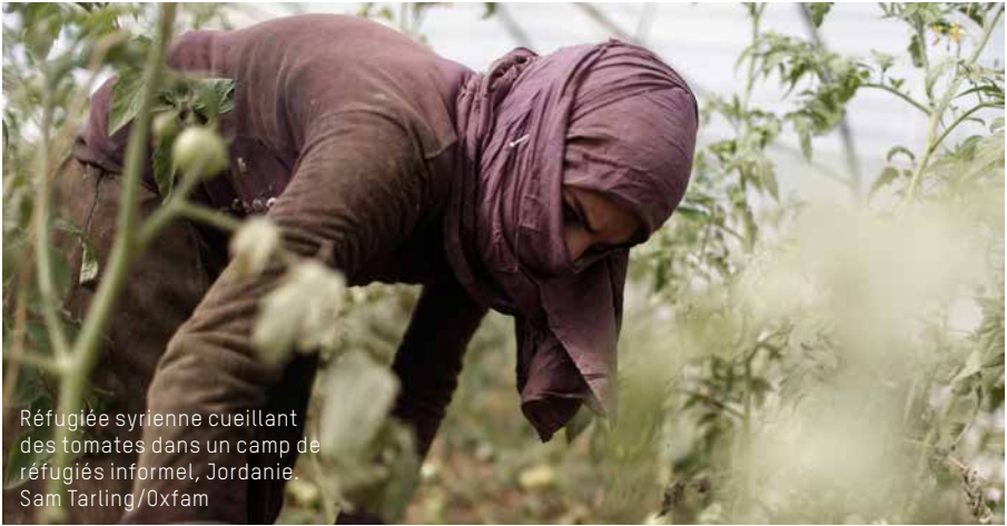
Réfugiée syrienne cueillant des tomates dans un camp de réfugiés informel, Jordanie.

Si votre organisation a défini sa propre politique de gestion responsable des données, il peut être judicieux de commencer par présenter cette dernière aux participant-e-s.